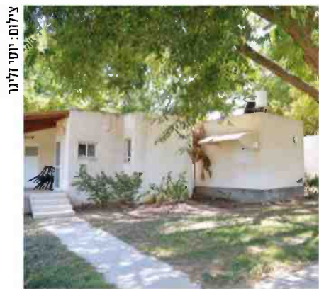
כפר עזה. התושבים אינם ממהרים לשוב