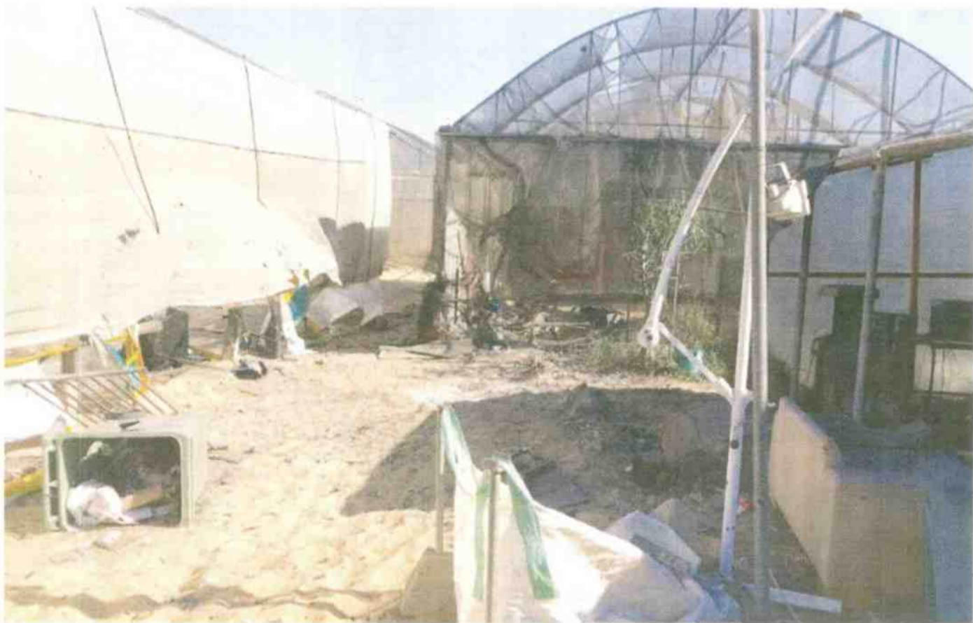
זירת הנפילה במועצה האזורית אשקלון "שטח פתוח הוא מקום העבודה שלנו"

זהו העובד התאילנדי השני שנהרג באזור בארבע שנים • עשרות טילים נורו ליישובי הדרום, השפלה והמרכז • משרד האוצר יקצה שלושה מיליון וחצי שקלים להצבת מיגוניות בשטחים חקלאיים