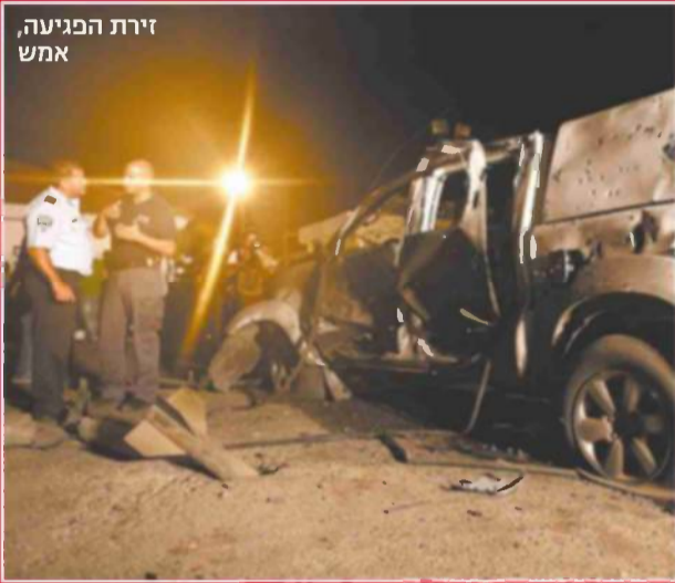
זירת הפגיעה, אמש