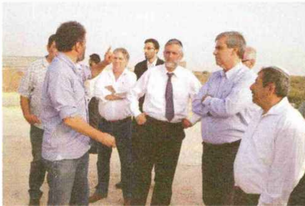
השר ישי בסיוור בישובים

סגן ראש הממשלה ושר הפנים, ר' אלי ישי, קיבל אזרחות כבוד מטעם המועצה האזורית חוף אשקלון, כאות הוקרה על עשייה ציבורית וחברתית מתמשכת לטובת כלל הציבור בישראל וקידום רמת השירות לתושבי המועצה האזורית חוף אשקלון. "תרומתך הייחודית ביישובי קו עימות דרומי וגישתך האנושית כליווי ושיקום מפוני גוש קטיף" סייעו לקרוב לבבות ותרמו לאחדות ישראל", נכתב בתעודה. השר ישי סייר באתר ניצן וביישוב החדש באר גנים והתרשם מהליך מעבר מפוני גוש קטיף לבתי הקבע. "זהו אתגר עבורי לחבר את המפונים", ציין השר ישי והוסיף: "במועצה יש שילוב של קבוצות ממגזרים שונים החיים יחדיו בהרמוניה. זה נפלא". בתום הסיוור, נערכה ישיבת עבודה משותפת,